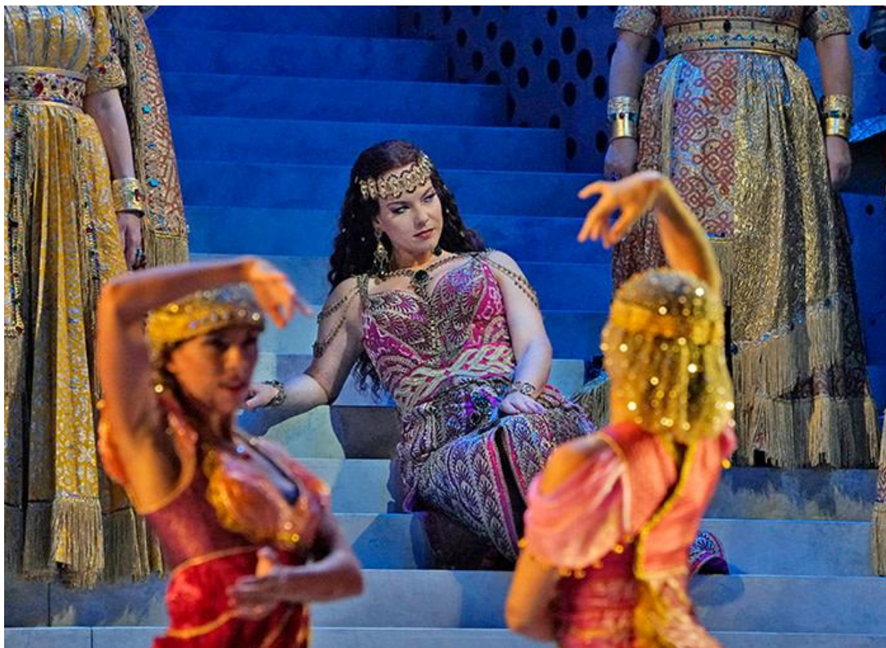
5-сурет – Элина Гаранча Далила рөлінде. Камиль Сен-Санстың «Самсон мен Далила» операсының екінші актісіндегі көрініс (Метрополитен опера, 2018.