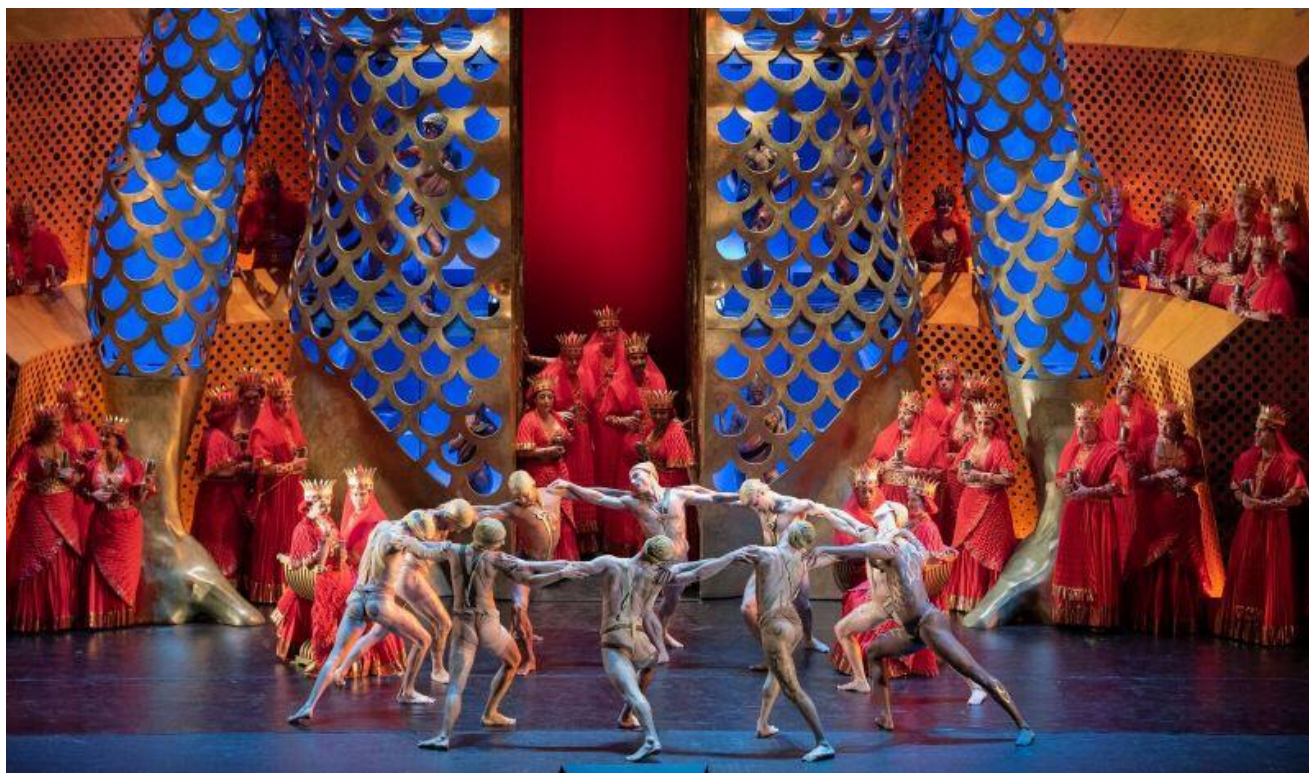
6-сурет – «Самсон мен Далила» операсының Метрополитен операсындағы қойылымындағы «Вакханалия» көрінісі (реж. Дарко Трешняк, хореограф Остин МакКормак, дирижёр Марк Элдер, 2018).